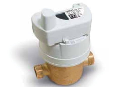
Aquadis+ εφοδιασμένο με το Cyble 5 module